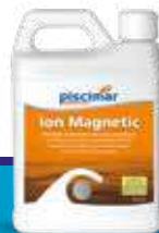
Ion Magnetic 1,2 kg

Elimina el cloro, bromo u oxígeno activo inmediatamente.