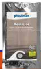
Resticlor 300 g